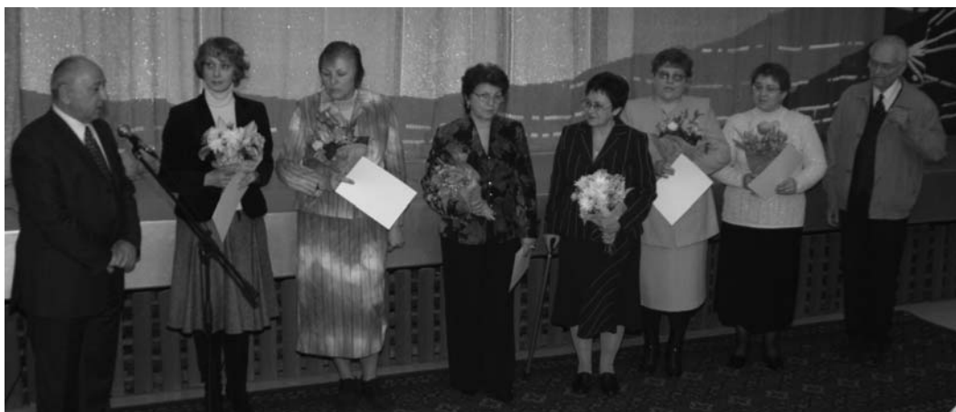
Учителя дубненских школ — лауреаты конкурса на гранты ОИЯИ за педагогическое мастерство