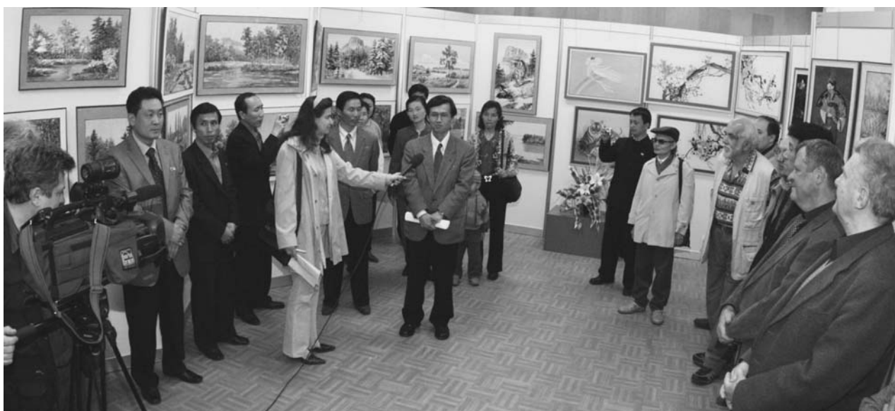
Музей истории науки и техники ОИЯИ, 14 мая. Открытие выставки корейского изобразительного и прикладного искусства «Искусство десяти тысячелетий»