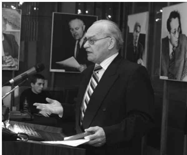
Дубна, 27–28 ноября. Сессия Комитета полномочных представителей правительств государств-членов ОИЯИ