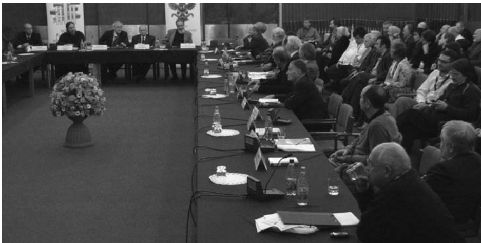
Дубна, 30–31 октября. XI конференция «Наука. Философия. Религия»