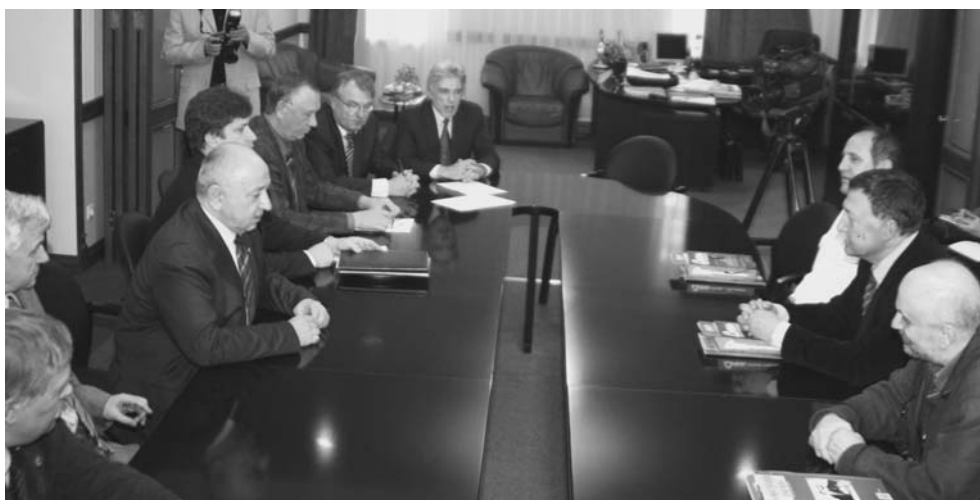
Дубна, 12 апреля. Подписание договора об ассоциированном членстве в ОИЯИ Республики Сербии