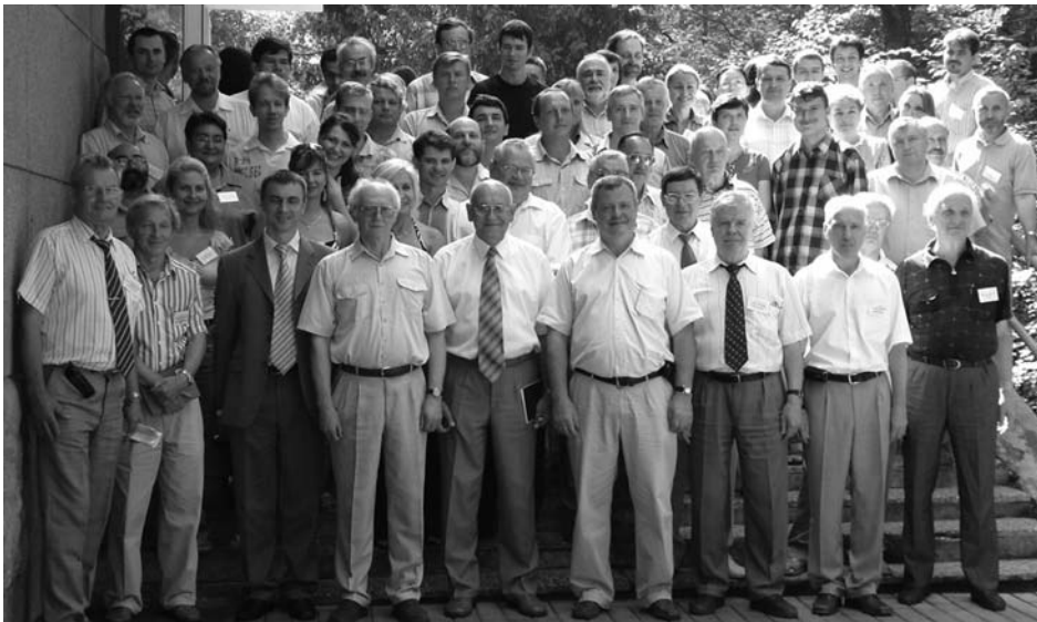
Гомель (Белоруссия), 23 июля – 3 августа. Участники IX Международной школы- семинара по актуальным проблемам физики микромира