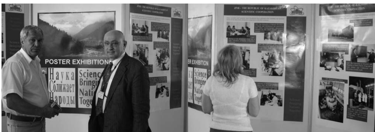
Алма-Ата, 4–7 июня. Совместная ОИЯИ–ЦЕРН выставка «Наука сближает народы», дополненная стендами, посвященными сотрудничеству ОИЯИ с научными центрами Казахстана