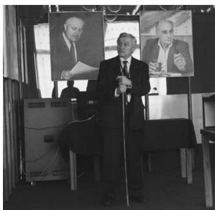
Дубна, 15 мая. Заседание Научно-технического совета ОИЯИ