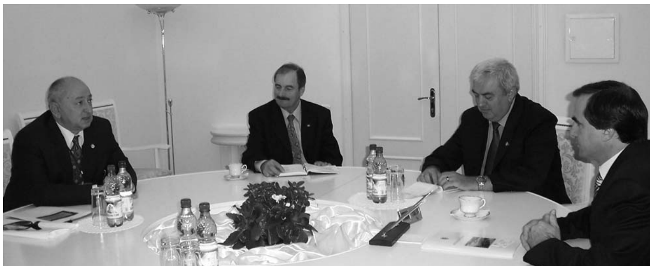
Кишинев (Молдавия), 21 сентября. Директор ОИЯИ А. Н. Сисакян на приеме у премьер-министра Республики Молдовы В. П. Тарлева (справа)