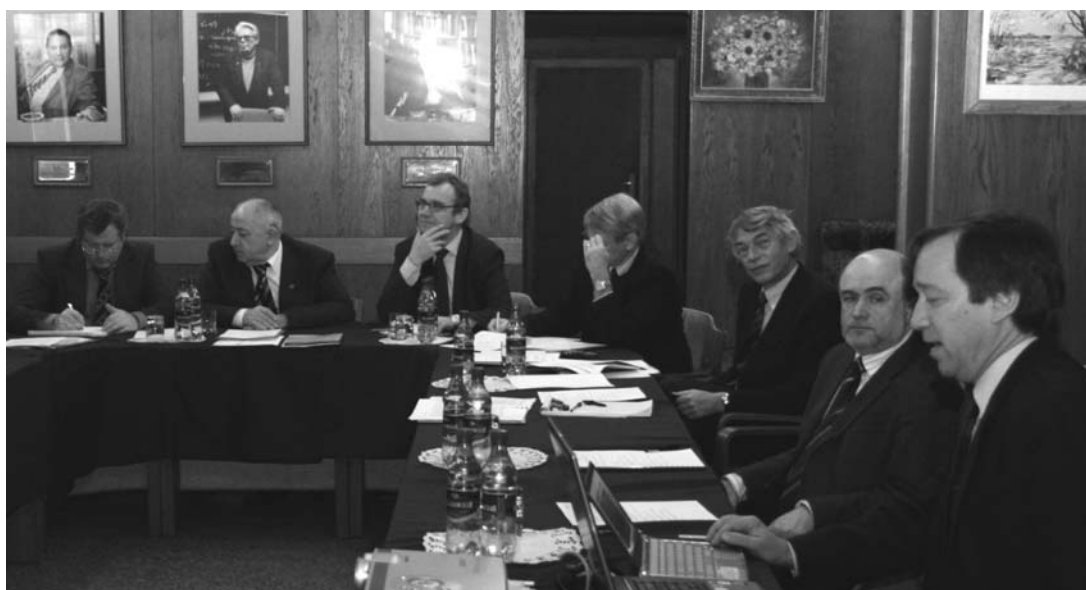
Дубна, 7 декабря. Заседание совместного комитета ЦЕРН–ОИЯИ по научному сотрудничеству