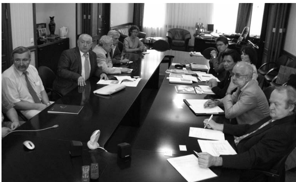
Дубна, 9 июля. Визит в ОИЯИ делегации немецкого научного общества Fraunhofer Gesellschaft (Общества Фраунгофера)