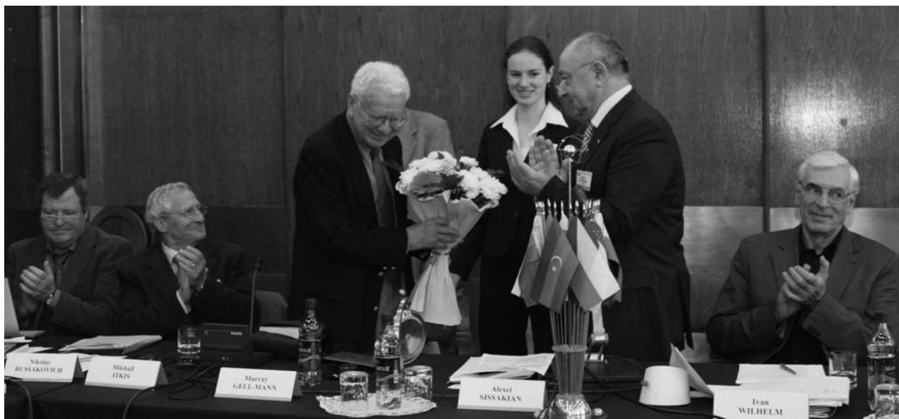
Дубна, 27–28 сентября. 102-я сессия Ученого совета