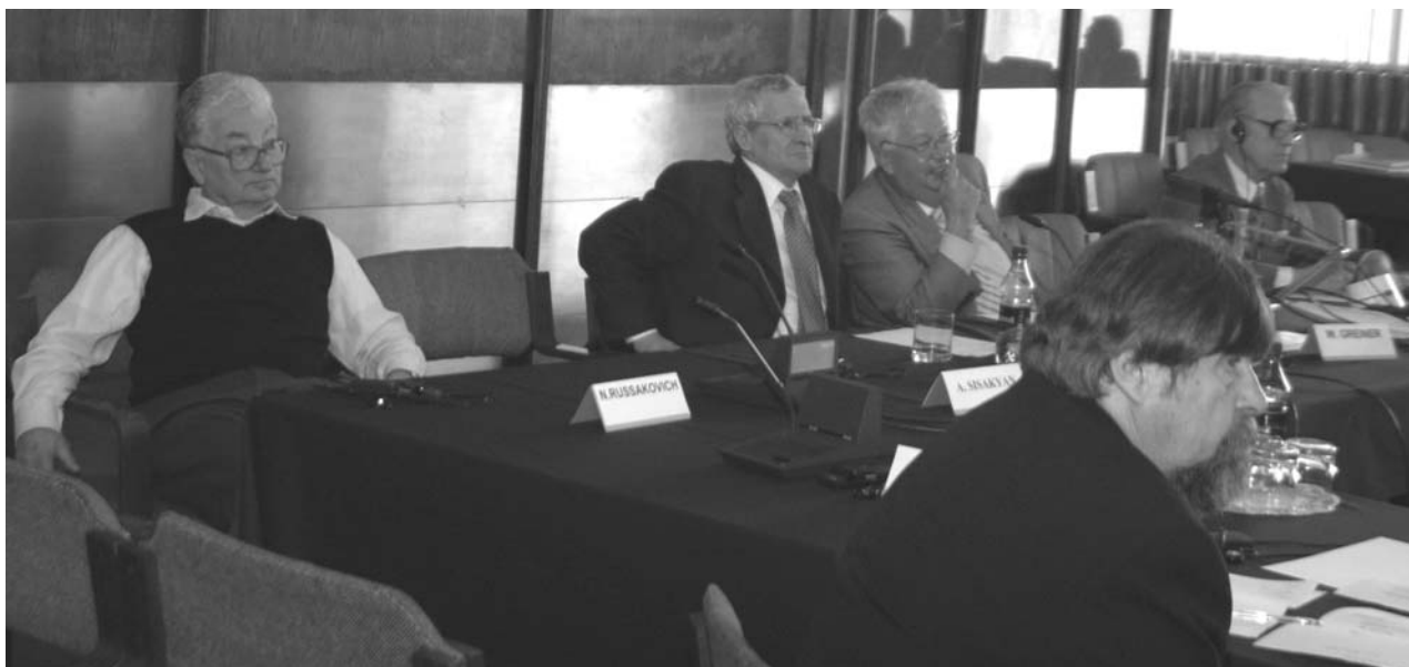
Дубна, 12–13 апреля. 26-я сессия Программно-консультативного комитета по ядерной физике