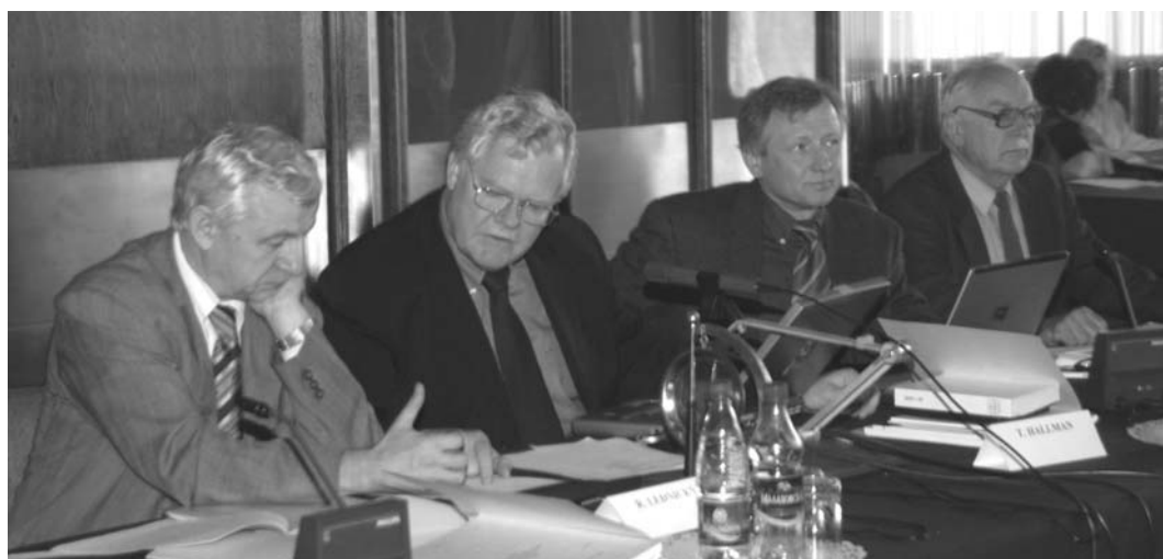
Дубна, 28–29 июня. 27-я сессия Программно-консультативного комитета по физике частиц