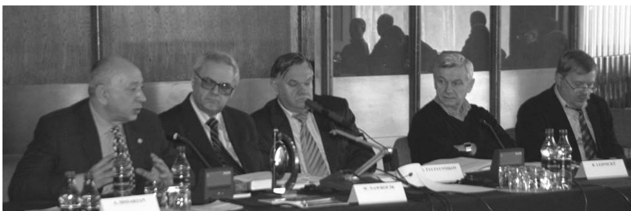
Дубна, 16–17 апреля. 26-я сессия Программно-консультативного комитета по физике конденсированных сред