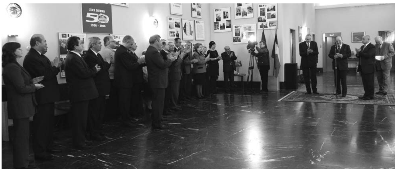
Москва, 29 ноября. Открытие фотовыставки, посвященной сотрудничеству научных центров университетов Румынии и ОИЯИ, в посольстве Румынии