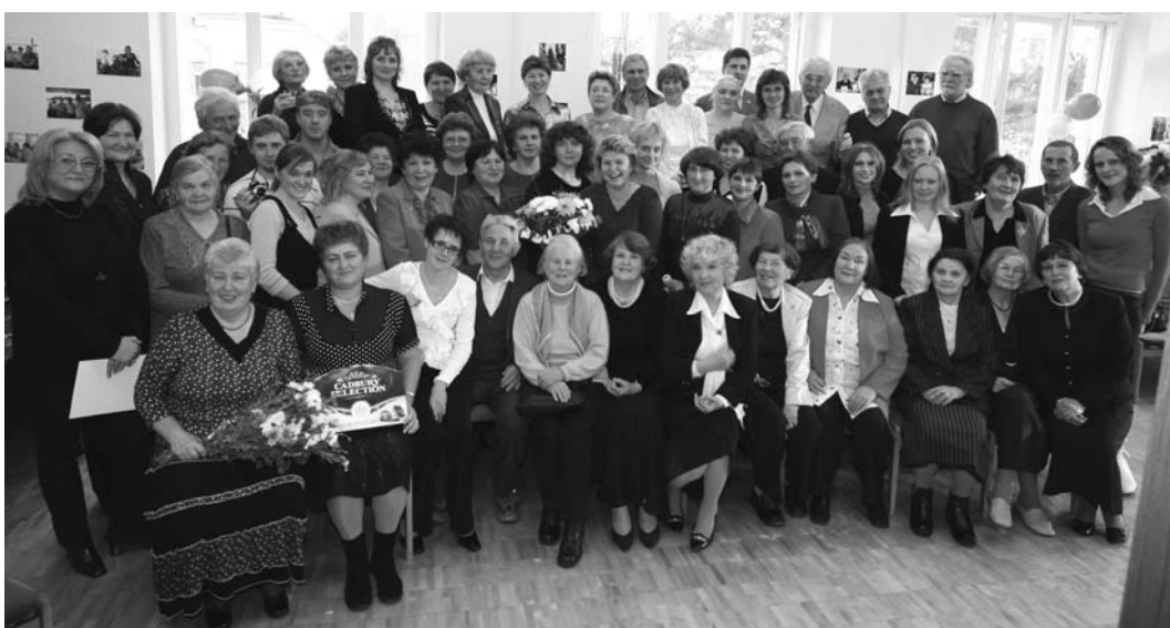
Дубна, 19 октября. Ветераны, сотрудники и гости издательского отдела в день празднования 50-летнего юбилея коллектива