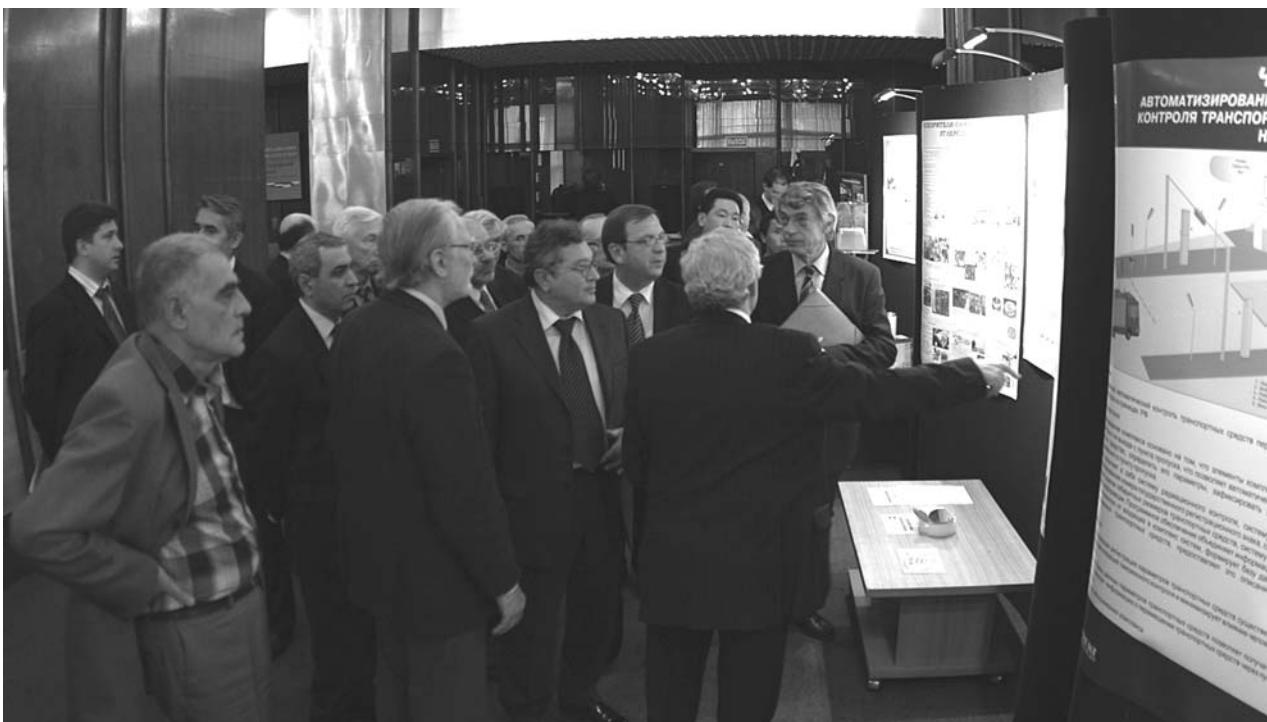
Участники сессии КПП знакомятся с выставкой «Инновационные технологии в ОИЯИ»