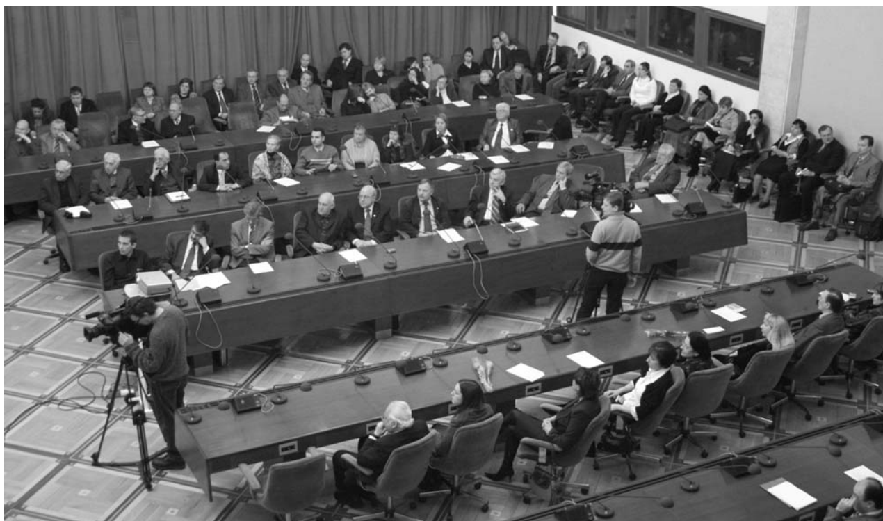
Москва, Дубна, 24–28 января. Симпозиум «Проблемы биохимии, радиационной и космической биологии», посвященный 100-летию со дня рождения академика Н. М. Сисакаяна