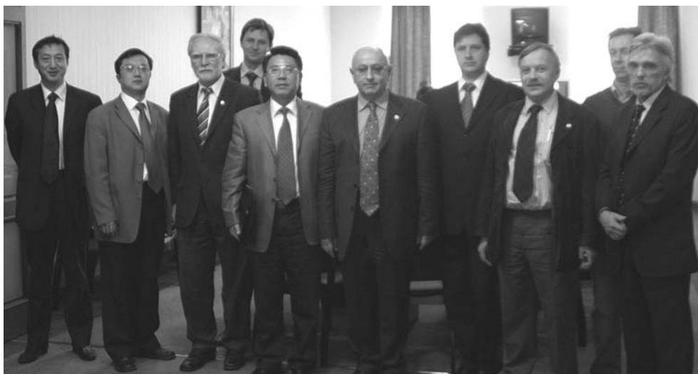
Дубна, 18 апреля. Встреча в дирекции ОИЯИ с делегацией посольства КНР в Москве