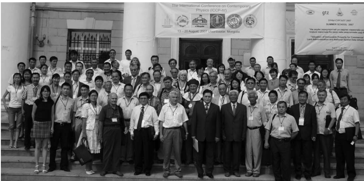
Улан-Батор (Монголия), 13 августа. Участники Международной конференции по современной физике у здания Национального университета Монголии