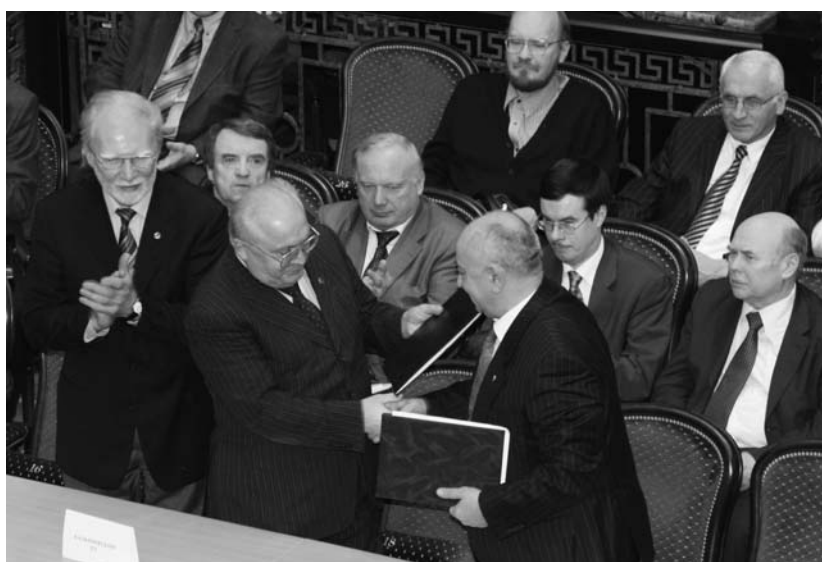
Москва, 24 декабря. Подписание Соглашения между ОИЯИ и МГУ им. М. В. Ломоносова о развитии сотрудничества в научно-исследовательской и образовательной деятельности