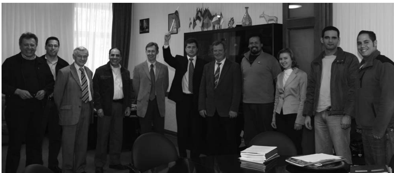
Дубна, 19 сентября. Встреча в дирекции ОИЯИ с правительственной делегацией Республики Венесуэлы