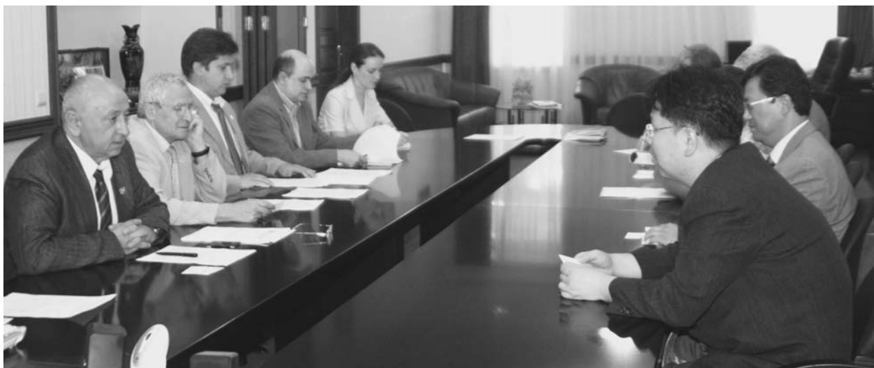
Дубна, 26 июня. Визит в ОИЯИ делегации Республики Кореи. Обсуждение перспектив научного сотрудничества