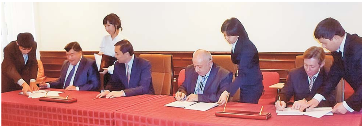
Астана (Казахстан), 19 ноября. Подписание соглашения о совместной подготовке бакалавров и магистров по ядерной физике между ОИЯИ и Евразийским национальным университетом им. Л. Н. Гумилева