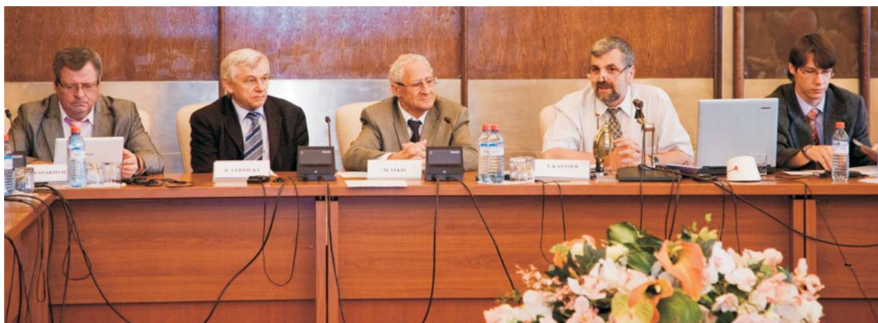
Дубна, 25–26 июня. Сессия Программно-консультативного комитета по физике конденсированных сред