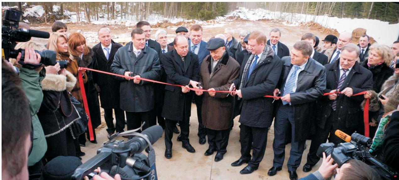
Дубна, 13 марта. Визит делегации ГК «РоснаноТех» во главе с генеральным директором А. Б. Чубайсом