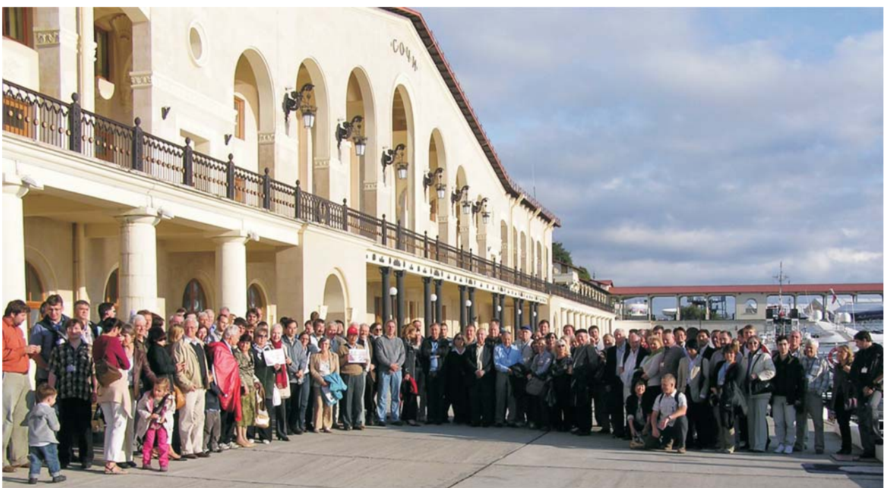
Сочи, октябрь. Участники международного симпозиума EXON-2009