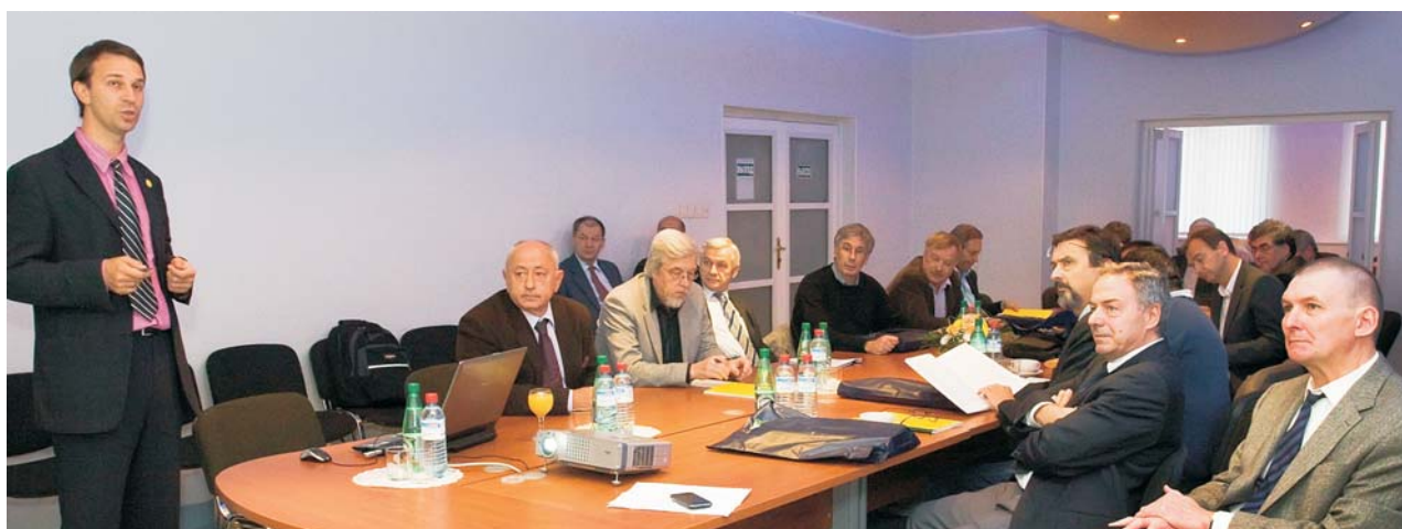
Дубна, 10 октября. Заседание Европейского комитета по ускорителям будущего (R-ECFA)