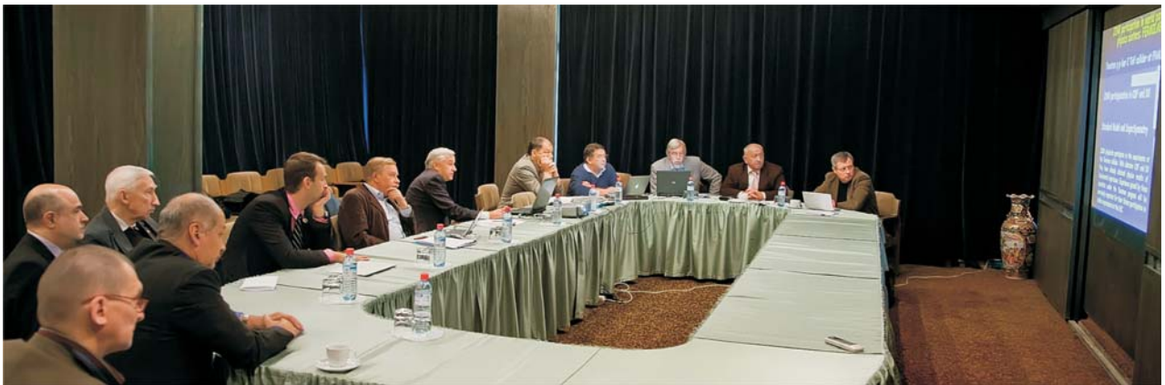
Дубна, 11 октября. Заседание Комитета по сотрудничеству ОИЯИ–ЦЕРН