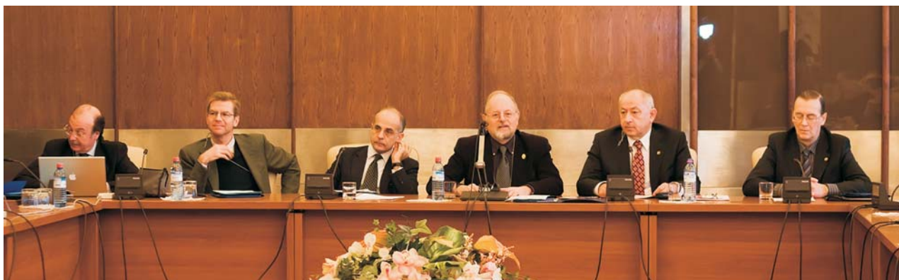
Дубна, 18–19 декабря. Президиум круглого стола Италия–Россия «Усилия в фундаментальных исследованиях и перспективы научно-технологических приложений и развития бизнеса»