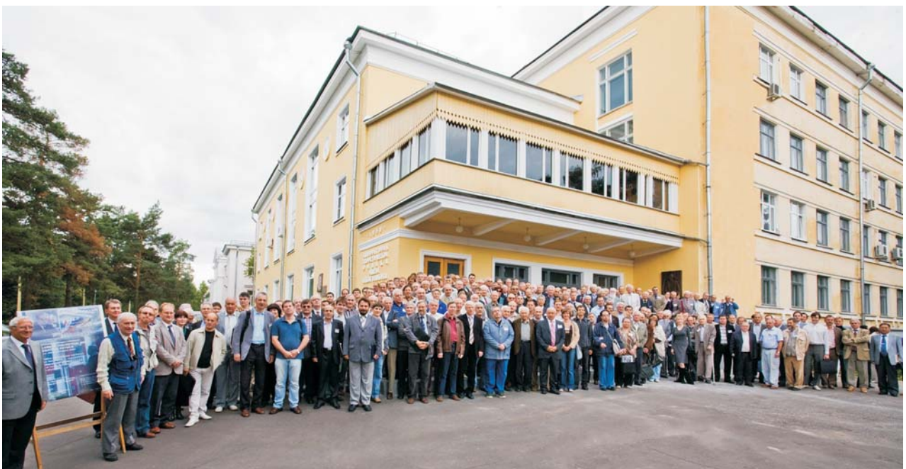
Москва–Дубна, 21–27 августа. Международная Боголюбовская конференция «Проблемы теоретической и математической физики»