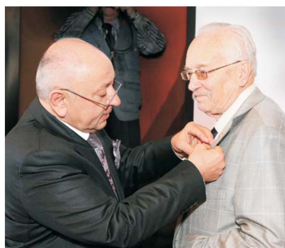
Дубна, 19–20 февраля. 105-я сессия Ученого совета ОИЯИ