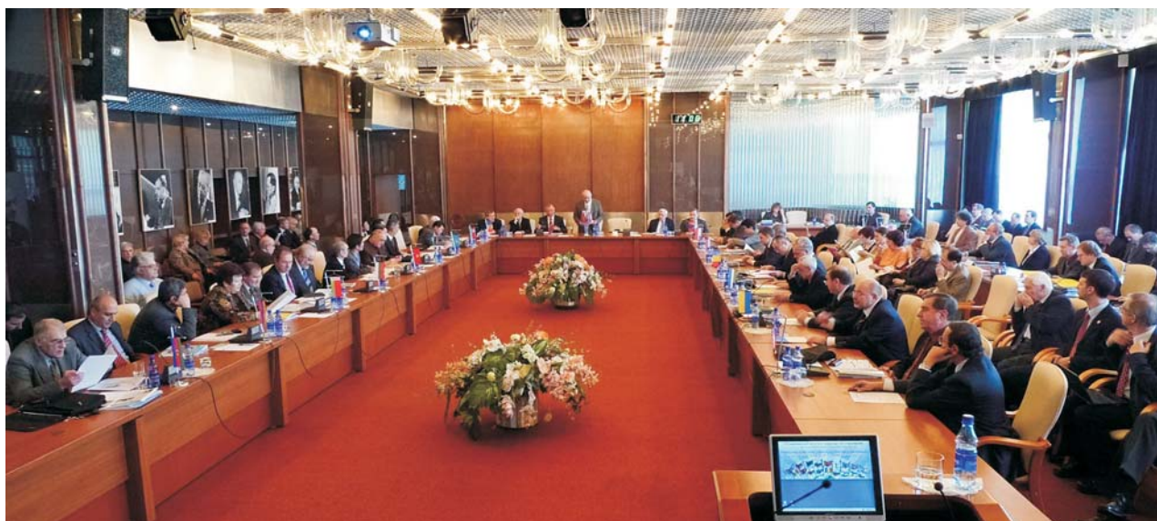
Дубна, 27–28 марта. Совещание Комитета полномочных представителей ОИЯИ