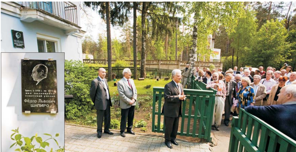
Дубна, 27 мая. Торжественное открытие мемориальной доски на доме, где жил Ф. Л. Шапиро