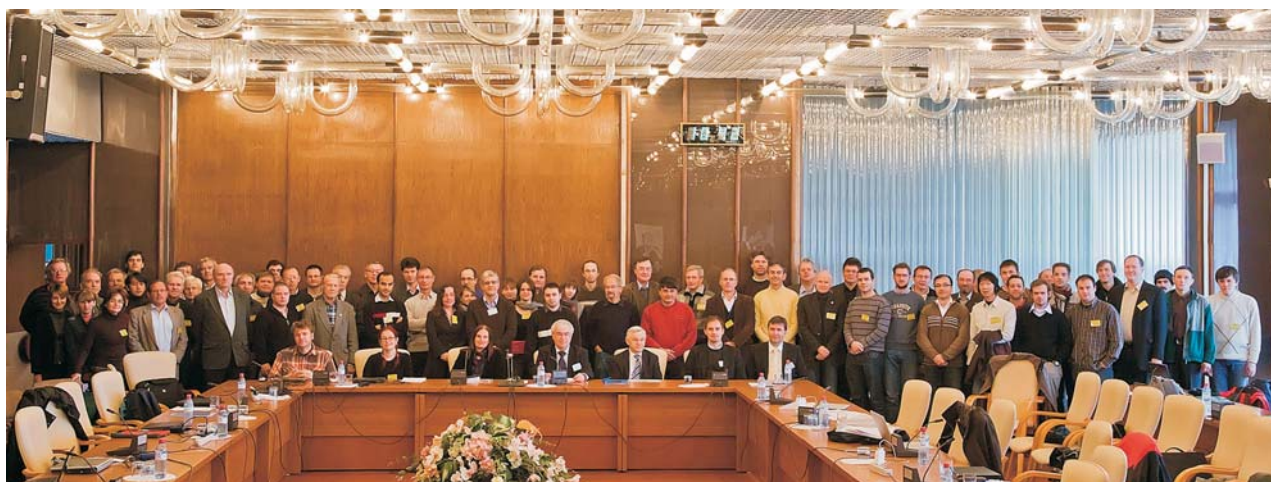
Дубна, 7 октября. Участники совещания по новым проектам сотрудничества NuSTAR в рамках программы FAIR (GSI, Германия)