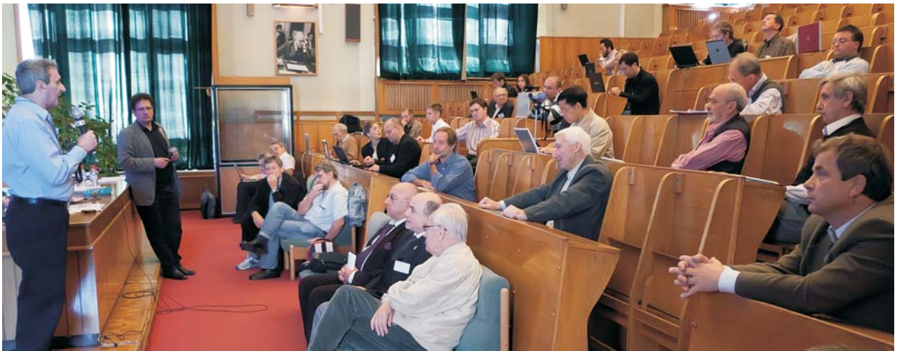
Дубна, 9 сентября. 4-й круглый стол «Физика на коллайдере NICA»