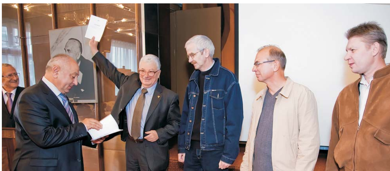
Дубна, 24–25 сентября. 106-я сессия Ученого совета ОИЯИ