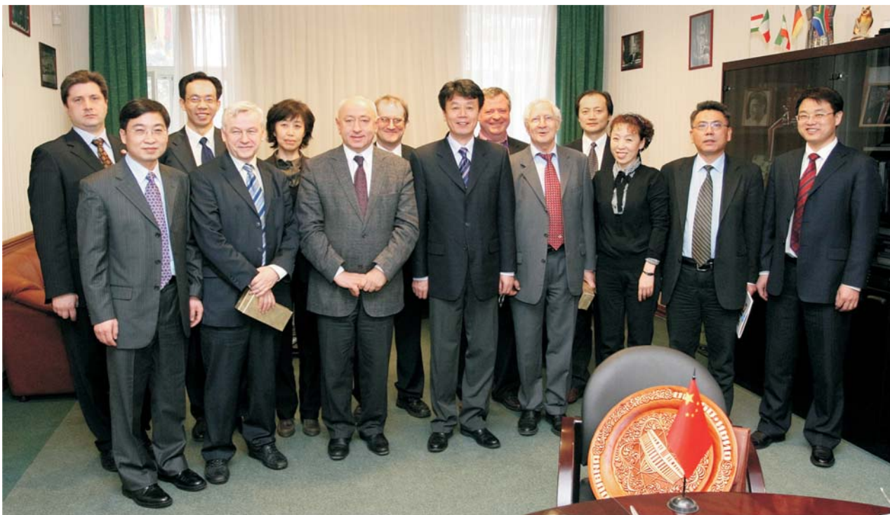
Дубна, 30 марта. Делегация Государственного управления Китайской Народной Республики по делам иностранных специалистов на приеме в дирекции ОИЯИ