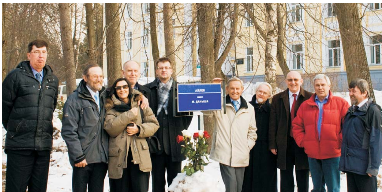
Дубна, 18 марта. Участники мемориального семинара, посвященного 100-летию со дня рождения Мариана Даныша