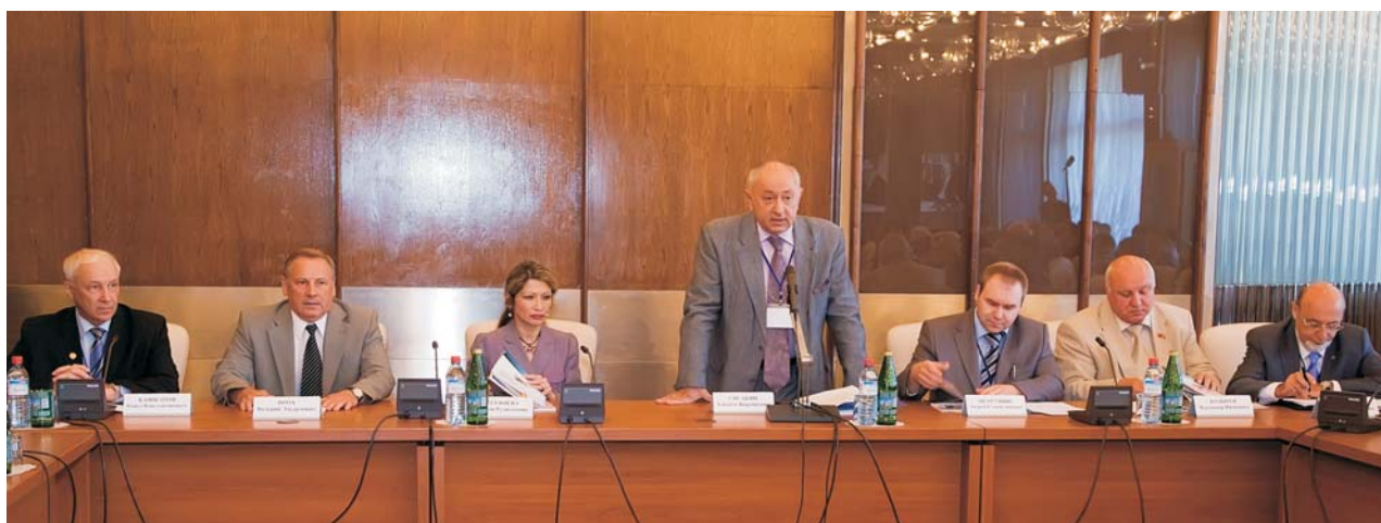
Дубна, 1 июля. Открытие организационно-информационного форума «Создание международного инновационного центра нанотехнологий стран СНГ»