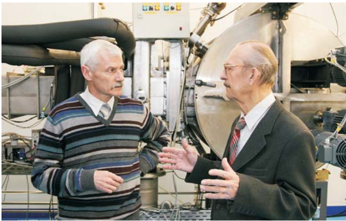
Лауреаты премии Правительства Российской Федерации в области науки и техники за 2008 г. П. Ю. Апель и Ю. Н. Денисов