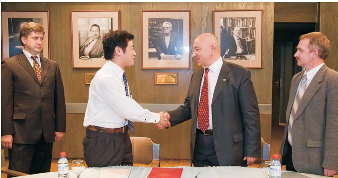
Дубна, 10 июня. Подписание Соглашения об академическом обмене между ОИЯИ и научной аспирантурой Токийского университета на 2009–2014 гг.