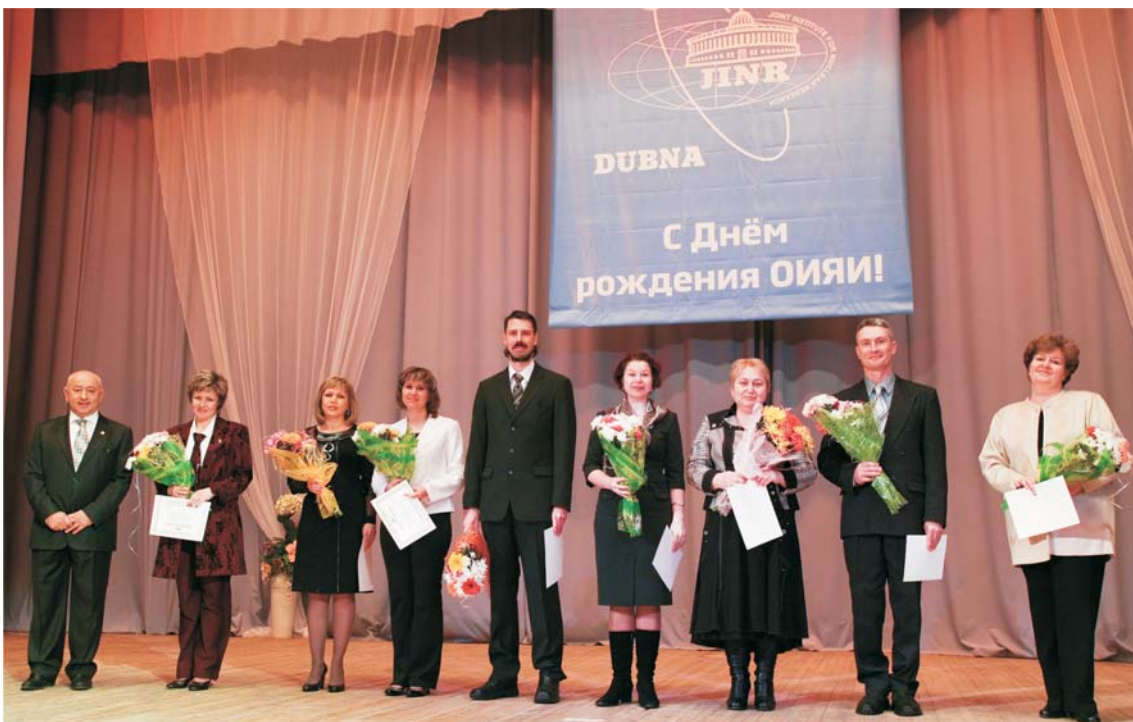
Дубна, 26 марта. Вручение дипломов лауреатам конкурса учителей Дубны в честь Дня образования ОИЯИ