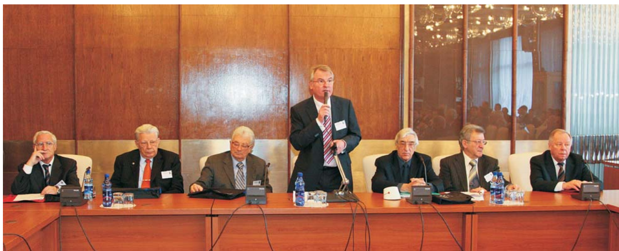
Дубна, 20 января. Международный научный симпозиум «Периодическая система элементов Д. И. Менделеева, ее значение и развитие. Новые сверхтяжелые элементы»