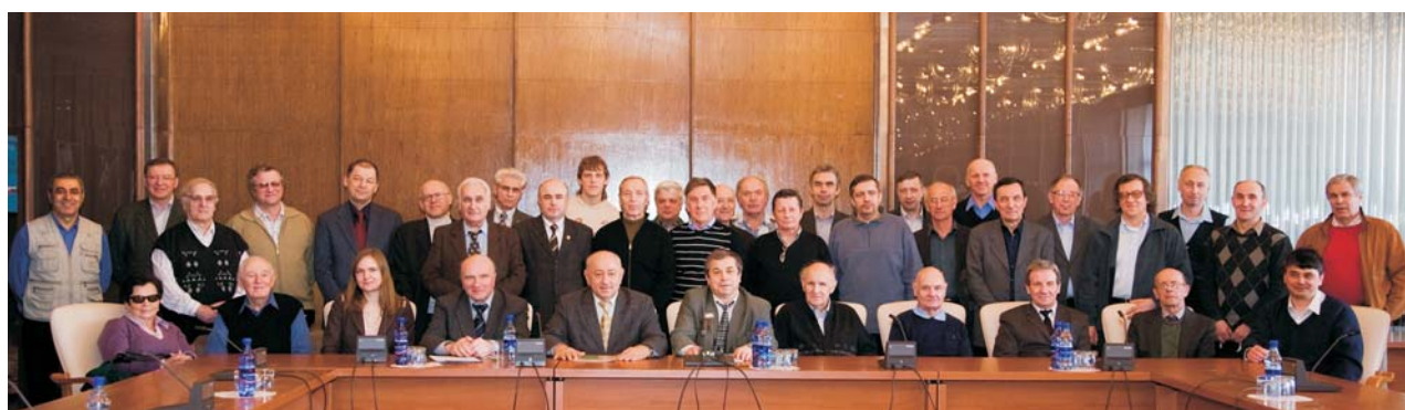
Дубна, 7–8 апреля. Участники совещания Научного совета РАН по физике электромагнитных взаимодействий «Электромагнитные взаимодействия релятивистских ядер и адронов»