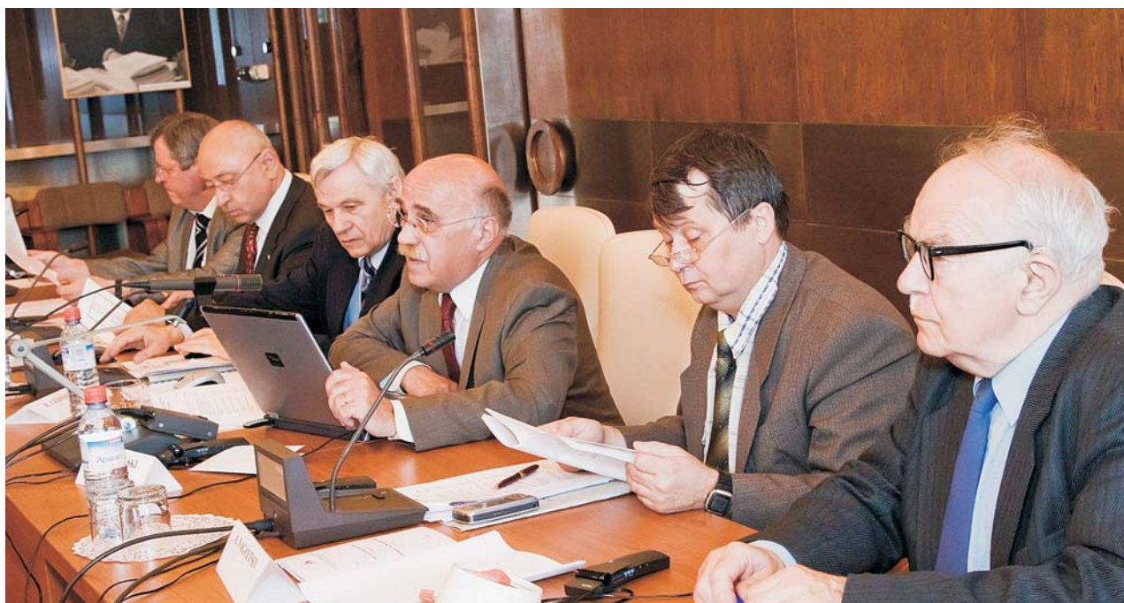
Дубна, 10–11 июня. Сессия Программно-консультативного комитета по физике частиц