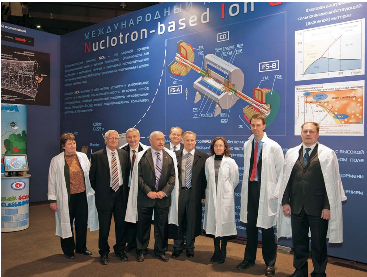
Дубна, 9 декабря. Визит в ОИЯИ министра экономического развития РФ Э. С. Набиуллиной