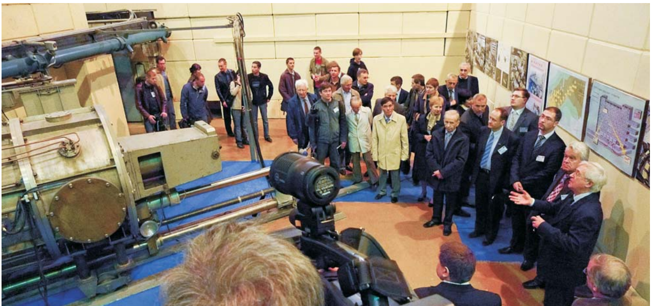
Дубна, 14–15 мая. Дни молдавской науки в ОИЯИ