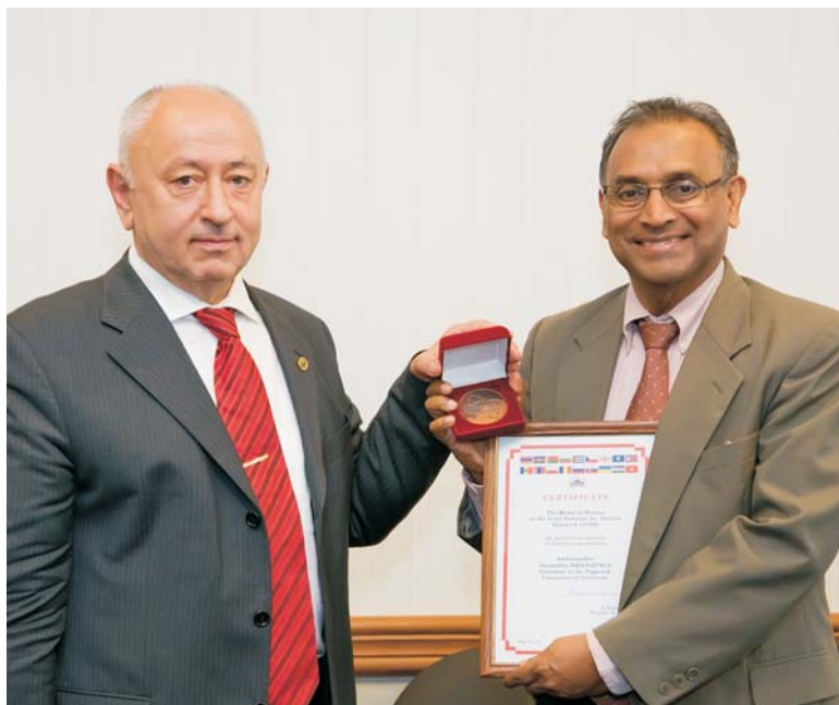
Дубна, 29 мая. Советники по науке и технике посольств стран-членов Евросоюза в ОИЯИ