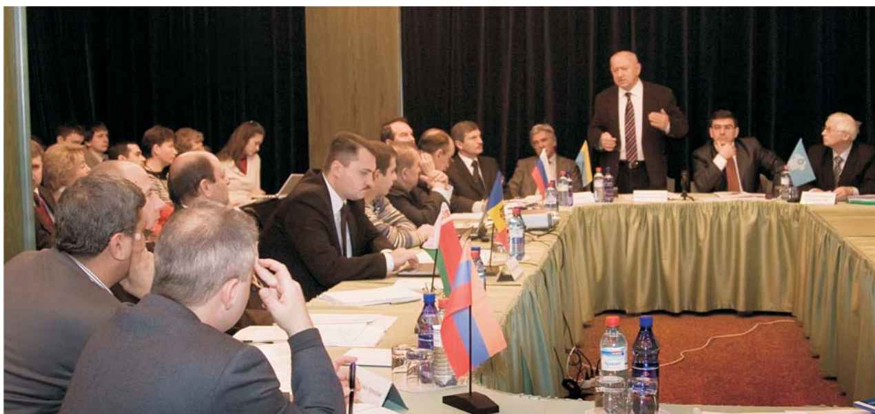
Дубна, 24 ноября. Второе заседание рабочей группы по разработке проекта Межгосударственной целевой программы инновационного сотрудничества государств-участников СНГ