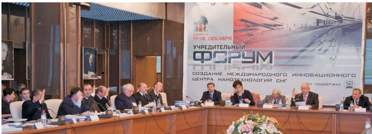
Дубна, 17–18 декабря. Учредительный форум «Международный инновационный центр нанотехнологий СНГ (МИЦНТ СНГ) — статус и перспективы»