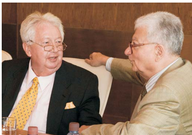
Дубна, 22–23 июня. Участники Программно-консультативного комитета по ядерной физике