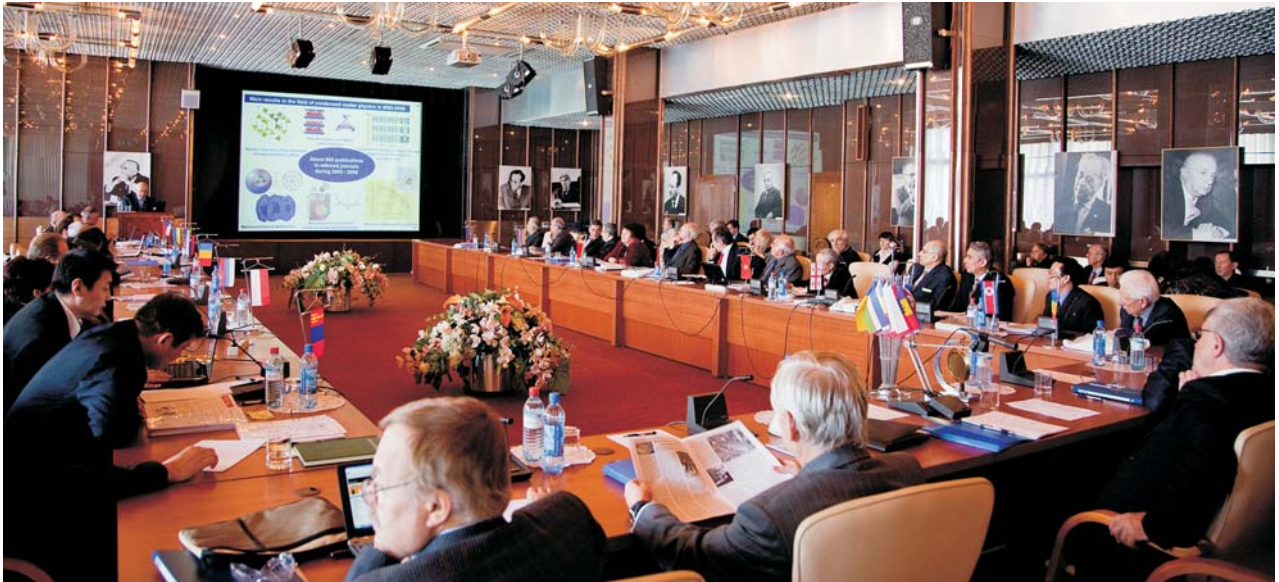
Дубна, 25–26 марта. Сессия Комитета полномочных представителей ОИЯИ