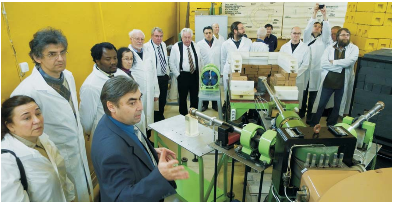
Дубна, январь. Заседания программно-консультативных комитетов по физике частиц, ядерной физике и физике конденсированных сред