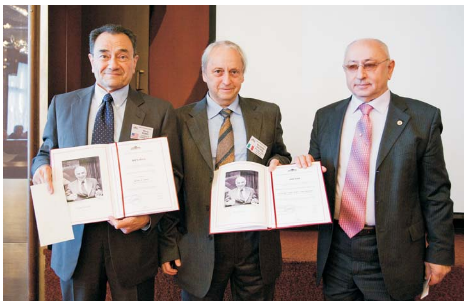
Дубна, 19 февраля. Профессора Г. Собел (Калифорнийский университет, Эрвайн, США), А. Д. Долгов (ИТЭФ, Москва) — лауреаты премии им. Б. М. Понтекорво 2009 г.