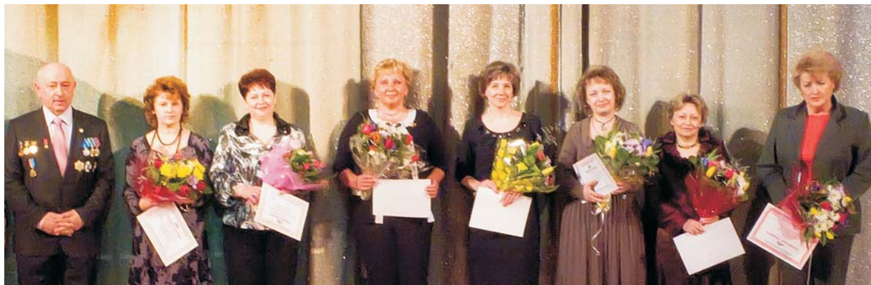
Дубна, 26 марта. Лауреаты конкурса учителей Дубны, которым присуждены гранты ОИЯИ «За педагогическое мастерство»