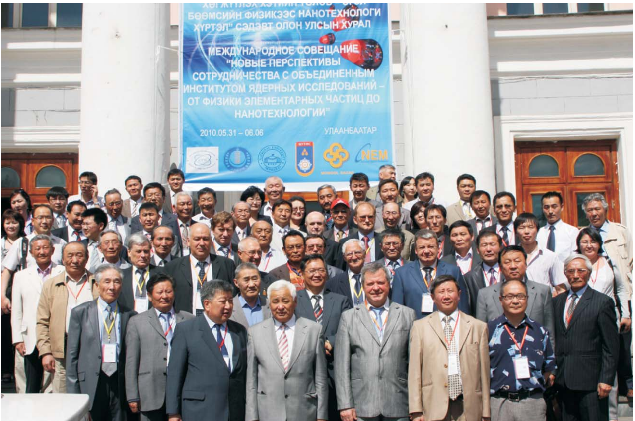
Улан-Батор (Монголия), 31 мая – 6 июня. Участники международного совещания «Новые перспективы сотрудничества с ОИЯИ — от физики элементарных частиц до нанотехнологий»