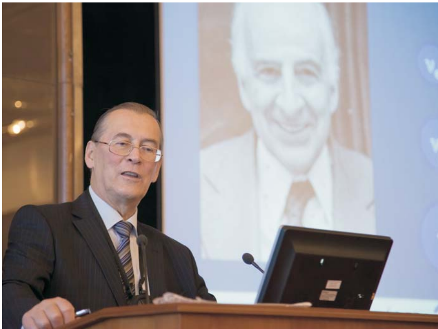
Дубна, 26–27 ноября. Сессия КПП ОИЯИ