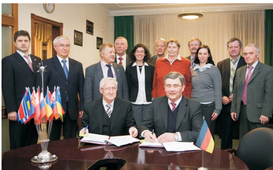
Дубна, 23 февраля. Участники 20-го заседания Координационного комитета по выполнению Соглашения между ВМБФ и ОИЯИ