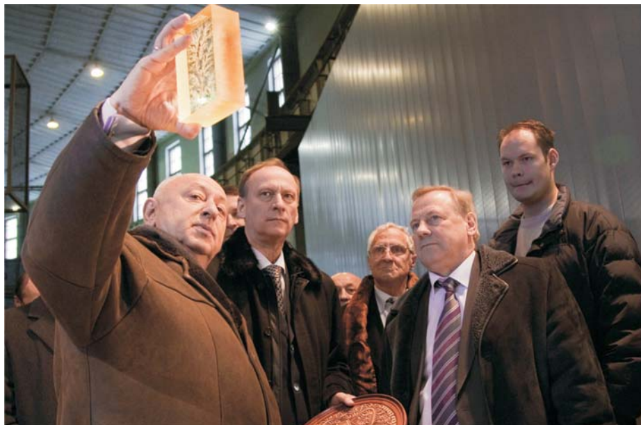
Дубна, 10 февраля. Секретарь Совета безопасности РФ Н. П. Патрушев в ОИЯИ