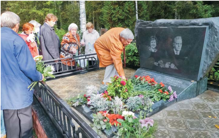
Дубна, 17 сентября. Семинар, посвященный 100-летию со дня рождения М. Г. Мещерякова, открытие памятника ученому на набережной Волги