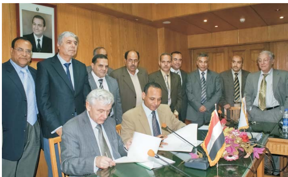
Каир (Египет), 2 декабря. Подписание решений Координационного комитета по сотрудничеству АРЕ–ОИЯИ