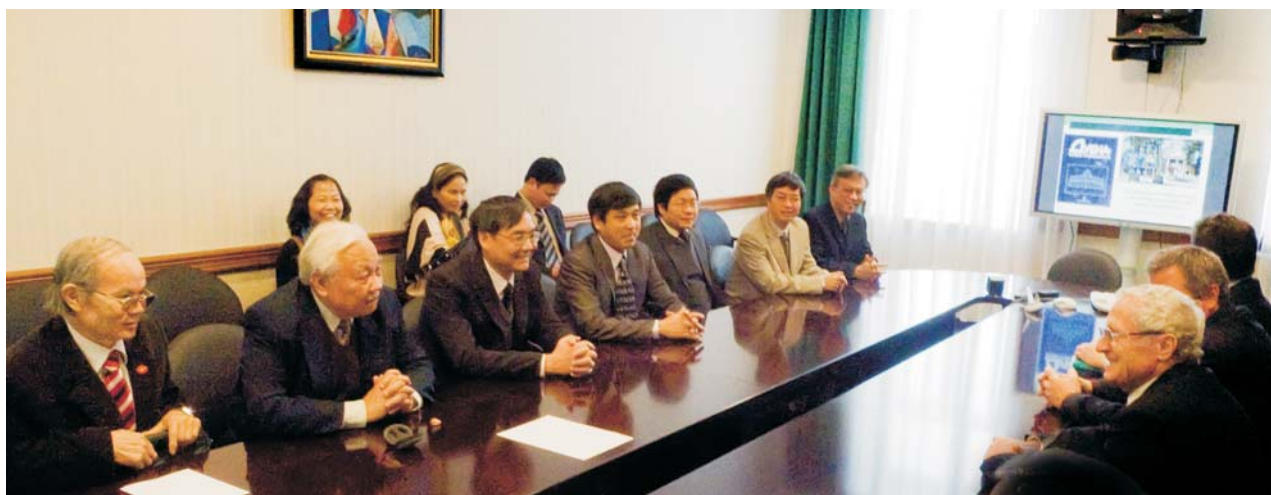
Дубна, 22 февраля. Вьетнамская делегация в дирекции ОИЯИ