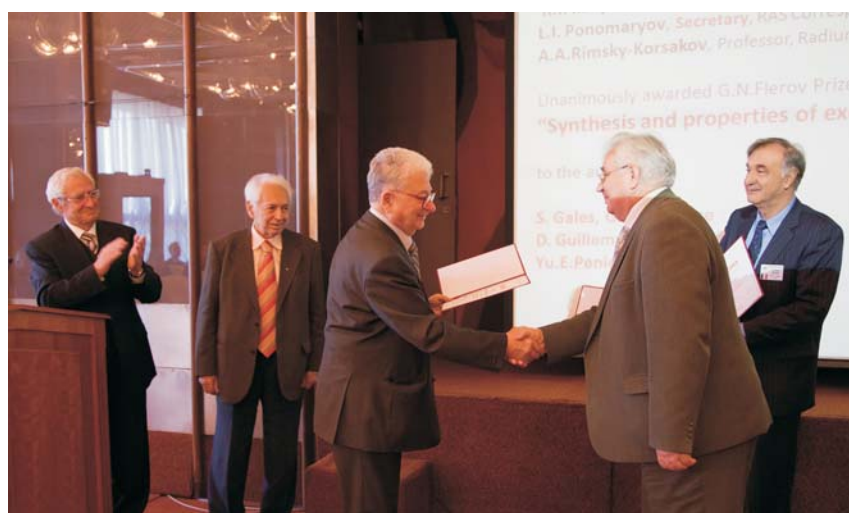
Дубна, 23–24 сентября. 108-я сессия Ученого совета ОИЯИ